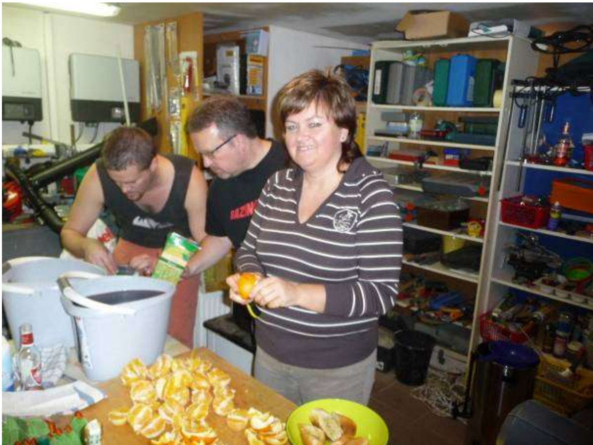
Základy kvalitního „rotariánského punče“ vznikají v kuchyni u Tůmů, ale ruku k dílu přikládají členové dle potřeby. I budoucí členové, jak vidno na spodním snímku.