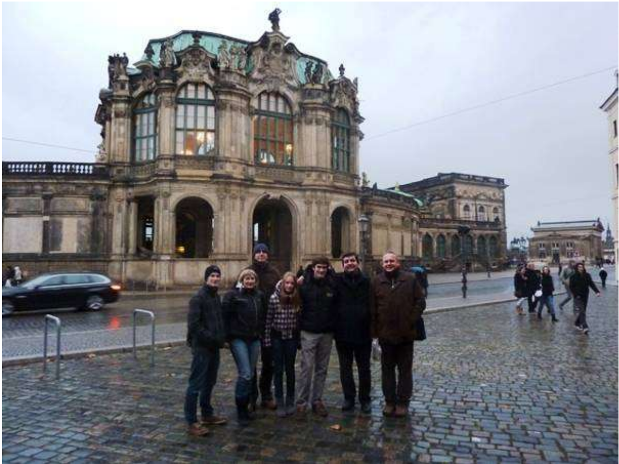
Naši v Drážďanech na předvánočních nákupech (společný zájezd RC Ostrava International a RC Opava International)